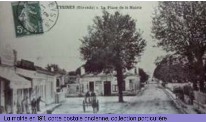
La mairie en 1911, carte postale ancienne

L' ancienne mairie (place Charles-de-Gaulle)