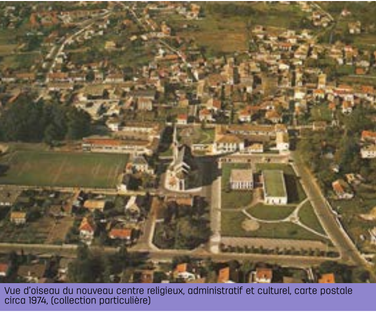
Vue d'oiseau du nouveau centre religieux, administratif et culturel, carte postale circa 1874, (collection particulière)