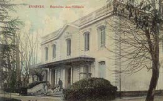
Château les Tilleuls, carte postale ancienne, (connaissance d'Eysines)