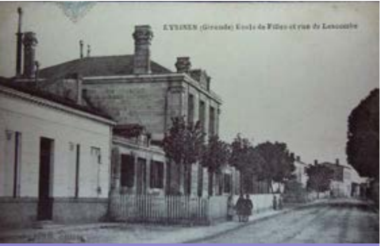
École de filles et rue de Lescombe, carte postale ancienne, (Ville d'Eysines)

Vers 1870, il existe, à Eysines, une école publique de filles dans des locaux loués par la commune. Cette école étant trop petite, dès 1875, des projets d'achat de terrains sont envisagés. Au cours de l'année 1881, la construction de l'école des filles et de la maternelle (mixte) est réalisée. Au centre, une maison sur deux niveaux abrite les logements des directrices de l'école maternelle et de l'école des filles. Dans les deux ailes en retour sur un niveau, sont installées d'un côté deux salles pour l'école maternelle et de l'autre côté deux salles pour l'école des filles, une clôture sépare la cour pour chaque école. Ces écoles ont accueilli des générations de petites Eysinaises jusqu'en 1953. Actuellement, l'école est occupée par la maison des associations et diverses salles municipales y ont été ajoutées.