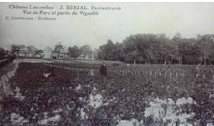
Le château de Lescombes, vue du parc et partie du vignoble, carte postale ancienne, (connaissance d'Eysines)

Quelques arbres plantés par les nombreux propriétaires du XIX e siècle rappellent par leur rareté et leur exotisme que l'on aimait recevoir au domaine !