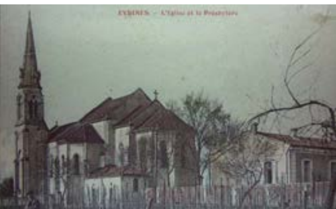
Église et son presbytère, carte postale ancienne, 1913

La paroisse d'Eysines possédait ici une église entourée d'un cimetière, elle datait du XIII e siècle ou XIV e siècle . Elle était en dehors du bourg, lui-même étant séparé de l'important village de Lescombes. La nef principale de l'église était romane et non voûtée, mais simplement couverte d'une charpente. Le clocher, roman à l'origine, a probablement été d'abord remanié au XIV e siècle puis transformé à la fin du Moyen Age en même temps que le portail sud. Au cours des siècles elle est peu entretenue, comme en témoignent les comptes-rendus des visites épiscopales. En 1847, elle est partiellement détruite par la foudre et interdite au culte. Après de longues hésitations, la municipalité choisit de ne pas la réparer et de la remplacer par l'église actuelle.