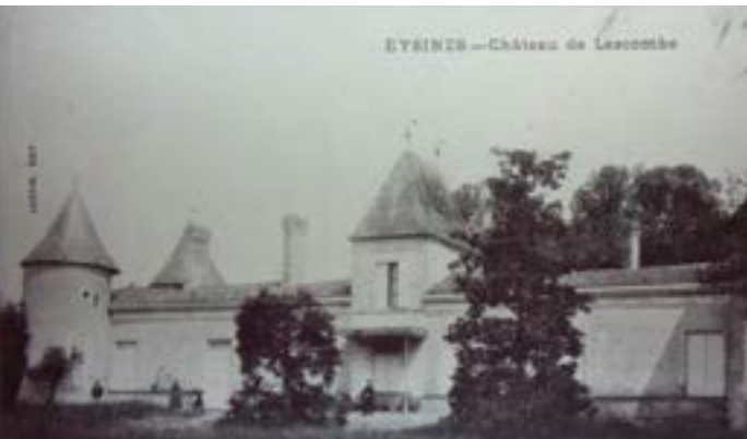
Le château de Lescombes au début du XXe siècle, carte postale ancienne, (collection particulière)